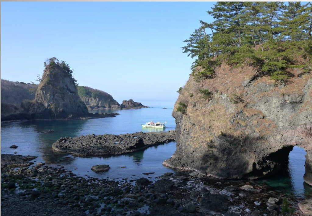
能登金剛・巖門周辺全景